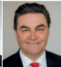
Klaus Herzog Oberbürgermeister